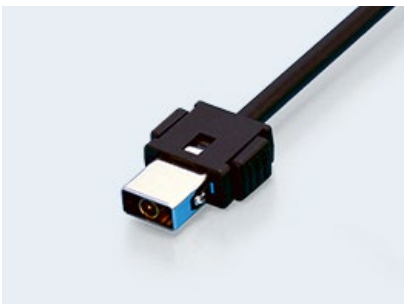
プラグ : CRC9001-7701F